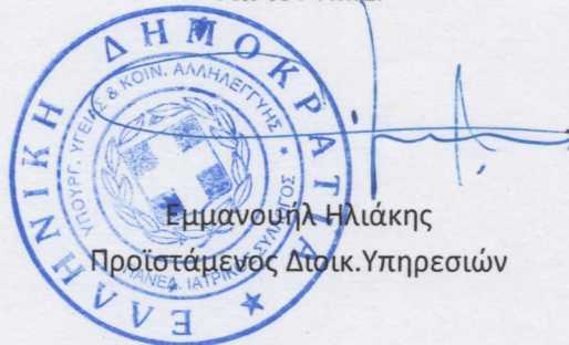
Εμμανουήλ Ηλιάκης Προϊστάμενος Διοικ.Υπηρεσιών