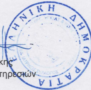
Εμμανουήλ Ηλιάκης Προϊστάμενος Διοικ.Υπηρεσιών