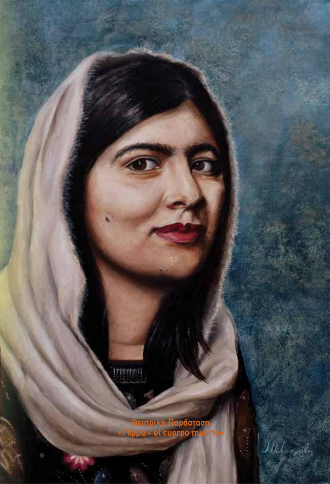
Θεατρική Παράσταση «Γέρμα - el cuerpo muerto»