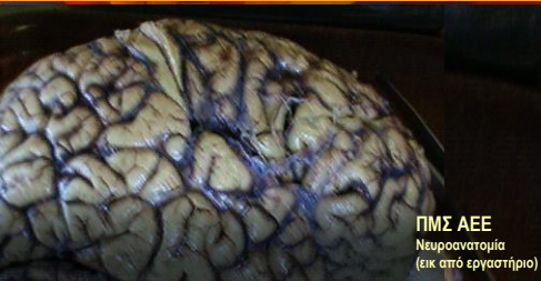
ΠΜΣ ΑΕΕ Νευροανατομία (εικ από εργαστήριο)