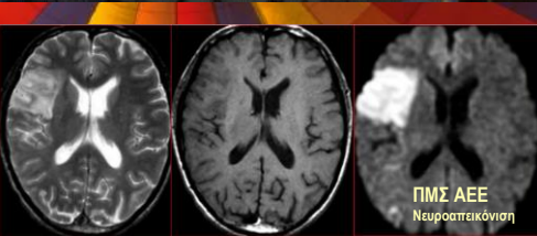
ΠΜΣ ΑΕΕ Νευροαπεικόνιση