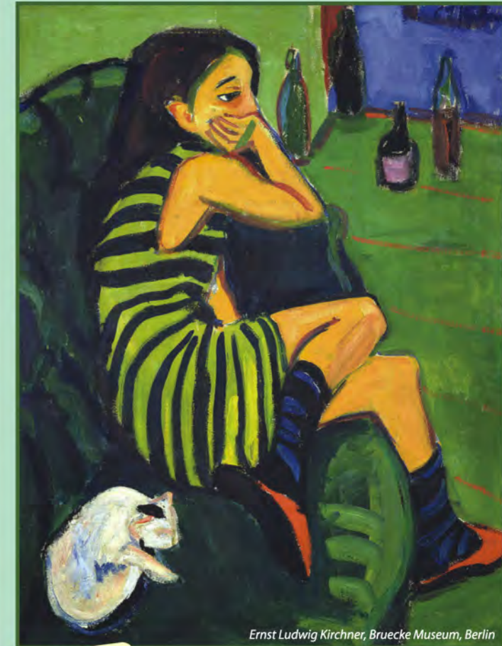
Ernst Ludwig Kirchner, Bruecke Museum, Berlin

Χορηγούνται Μόρια Συνεχιζόμενης Ιατρικής Εκπαίδευσης (C.M.E. credits) Πανελληνίως Ιατρικός Σύλλογος