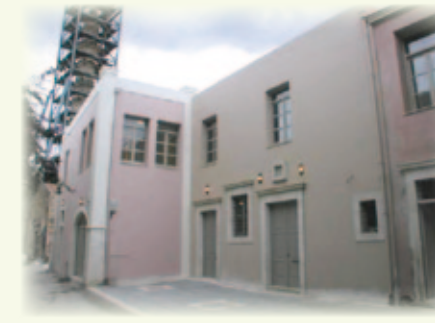
«Σπίτι Πολιτισμού» από οδό Εμμ. Βερνάρδου