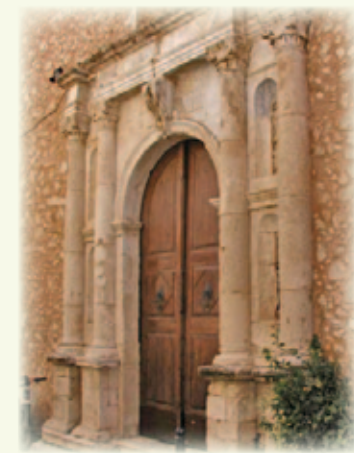
Τζαμί Γαζή Χουσεΐν Πασά (Νερατζέ) (σημερινό «Ωδείο»)