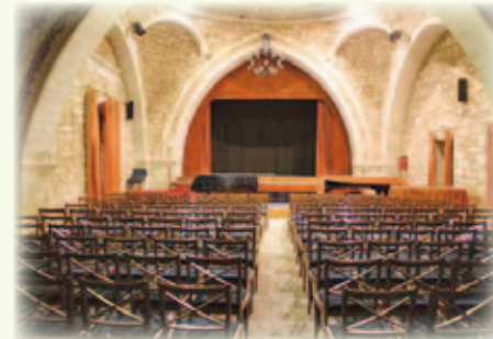
Νερατζέ Τζαμί εσωτ.