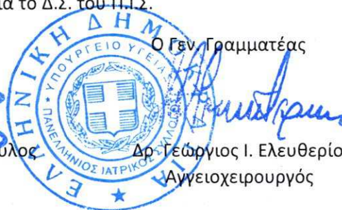
Δρ Γεώργιος Ι. Ελευθερίου Αγγειοχειρουργός